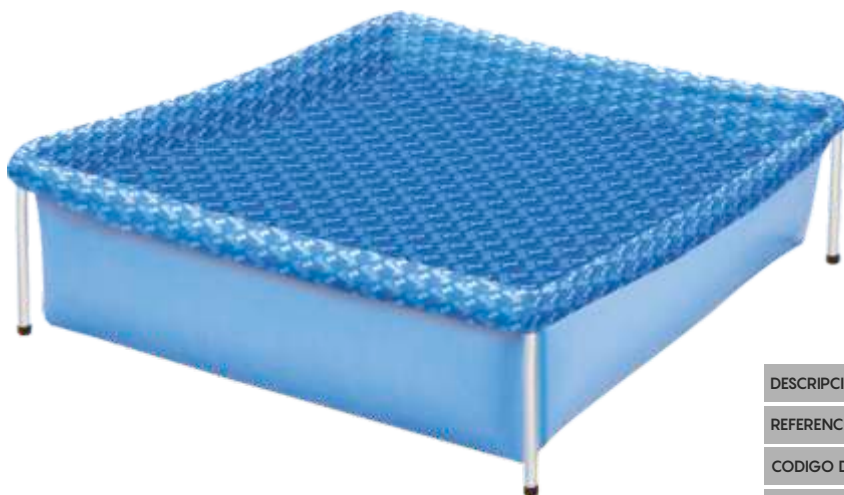
400 LITROS MEDIDAS: 1,15m x 1,06m x 0,33m